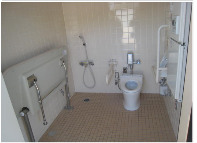
5F トイレには収納式多目的シートも設けられている。