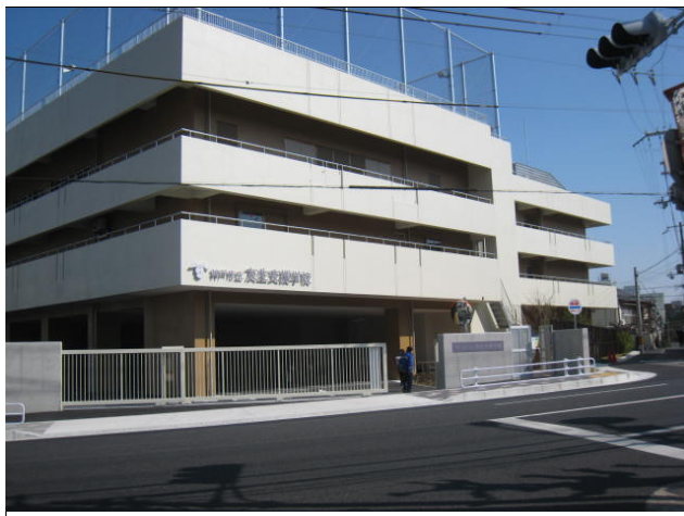
正門側(西面) 建物全景