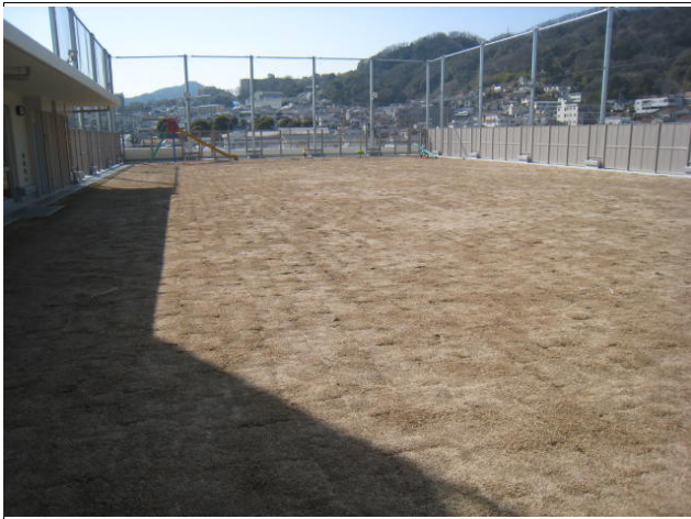
5F屋上部 広場芝生張、一部遊戯も設けられている。